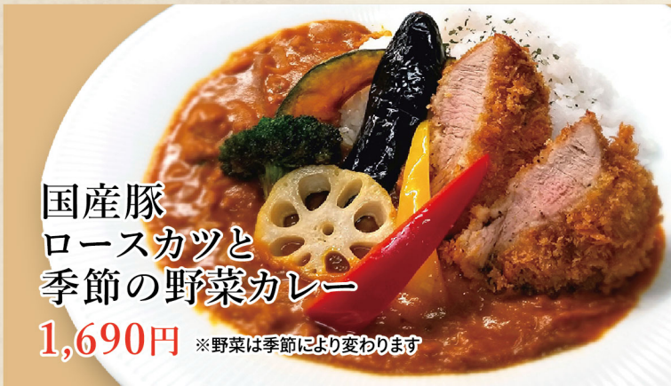
国産豚 ロースカツと 季節の野菜カレー 1,690円 ※野菜は季節により変わります