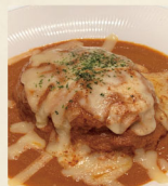
ハンバーグと 炙りチーズカレー 1,690円