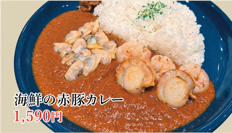
海鮮の赤豚カレー 1,590円