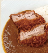
国産豚ロース カツカレー 1,490円