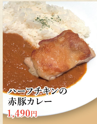
ハーフチキンの 赤豚カレー 1,490円