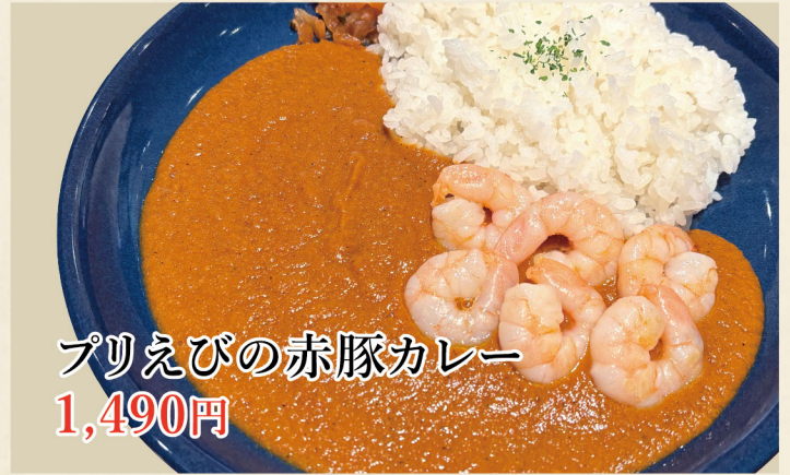
プリえびの赤豚カレー 1,490円