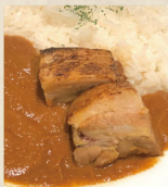
炙り角煮の 赤豚カレー 1,790円