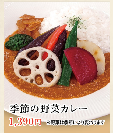
季節の野菜カレー 1,390円 ※野菜は季節により変わります